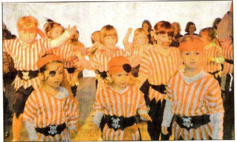
Die Kinder vom Gilchinger Tanzzentrum gaben ihr Können zum Besten und ernteten viel Applaus.